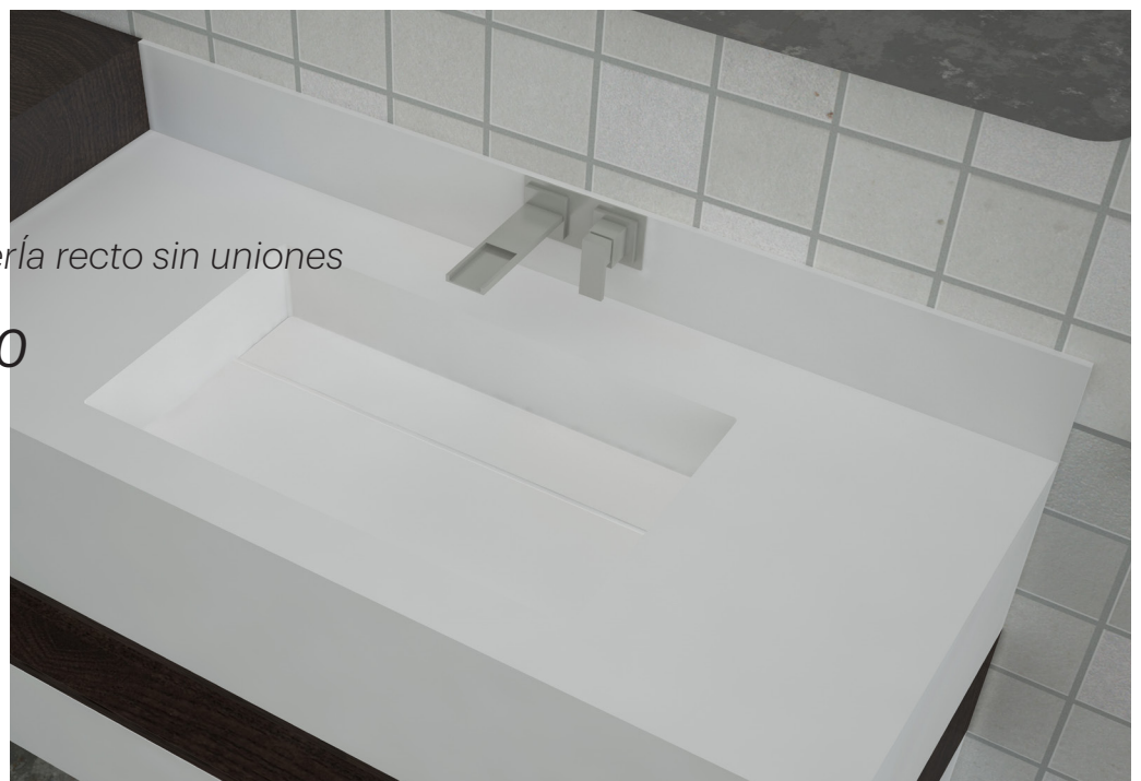
R HID 3050