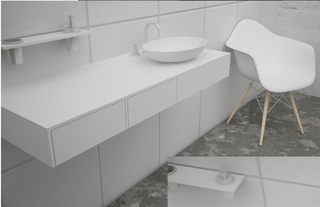
OVAL 3045 SP