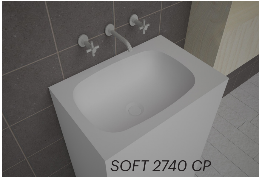
Pileta integrada en totem