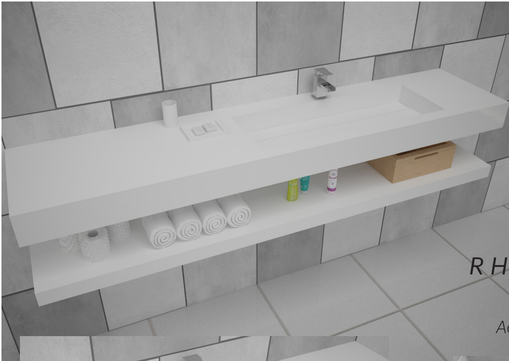
R HID 3085