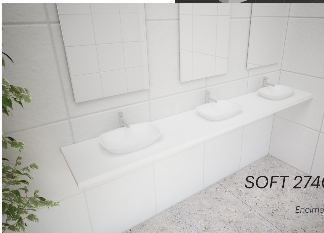
SOFT 2740 SP