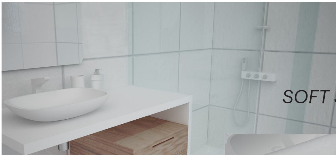
SOFT 3045 SP