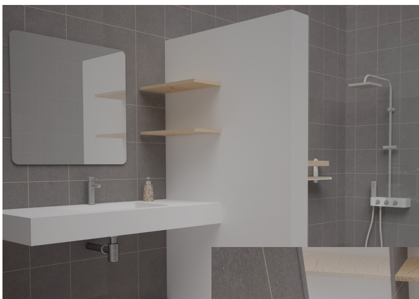
Muro separador, sin uniones, con la ducha Mecanizado para la colocación de estanterías