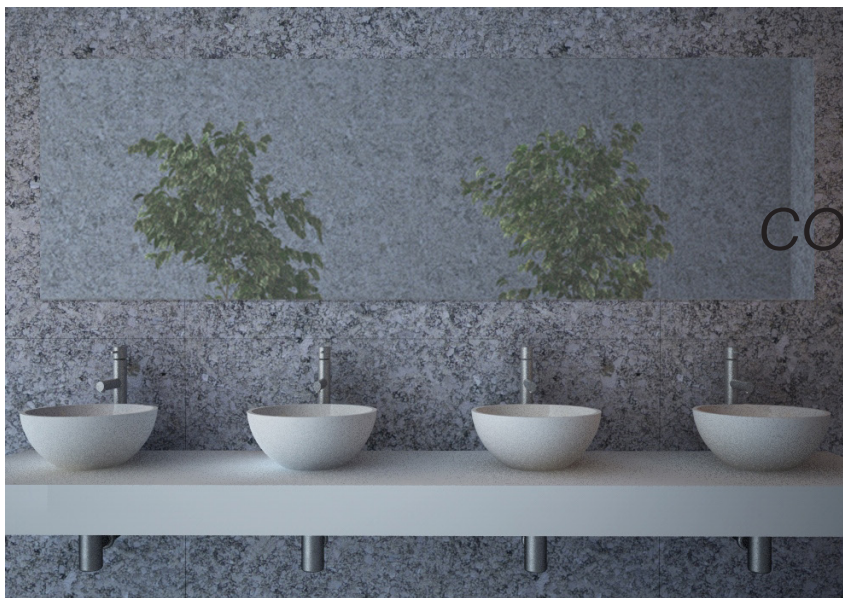
COIN D27 SP