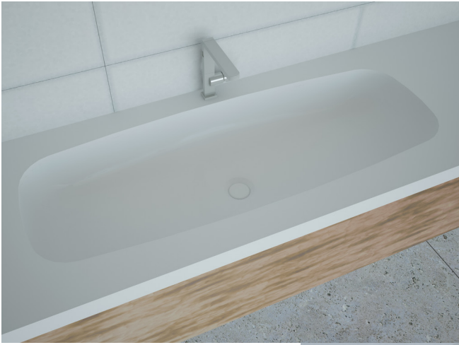
SOFT 3085 CP