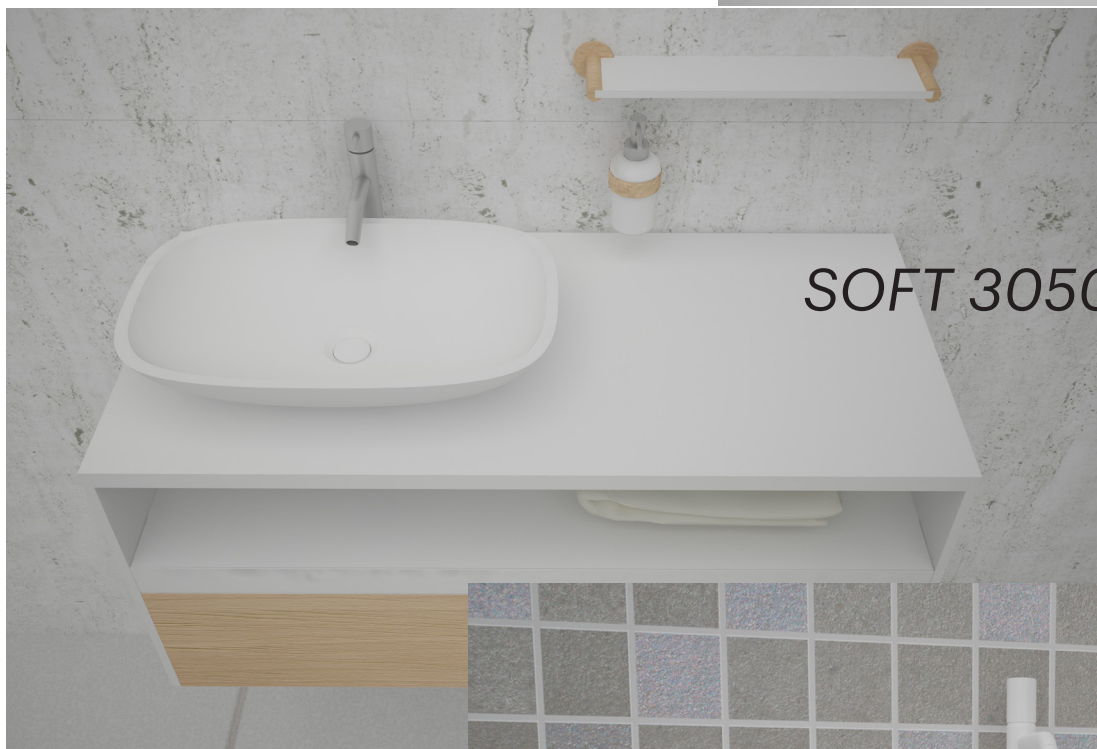
SOFT 3050 SP