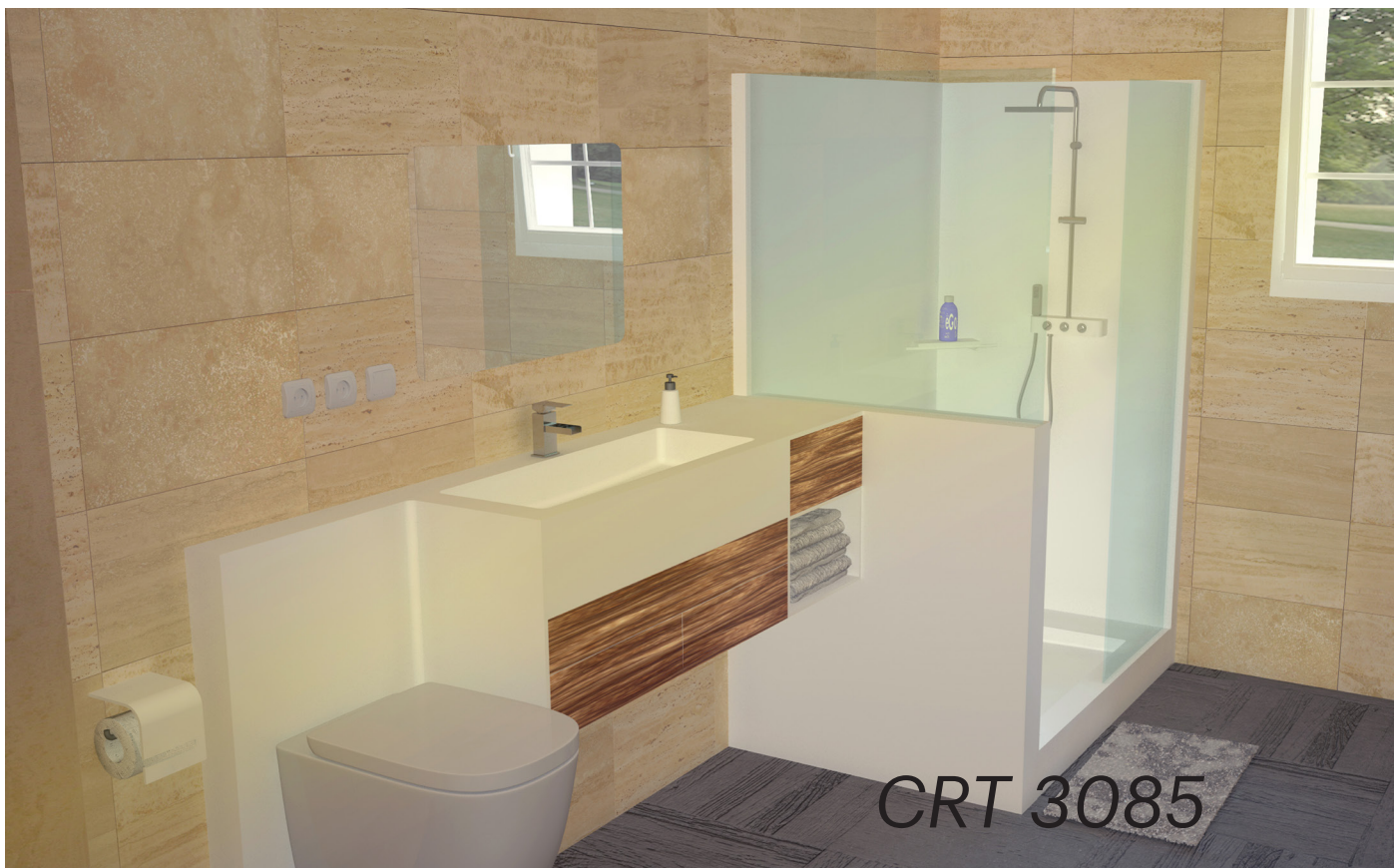
Modulo integrado para optimización de espacio