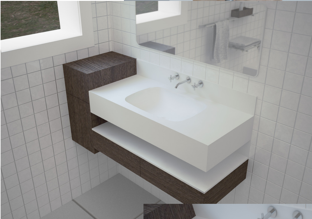
SOFT 3550 CP