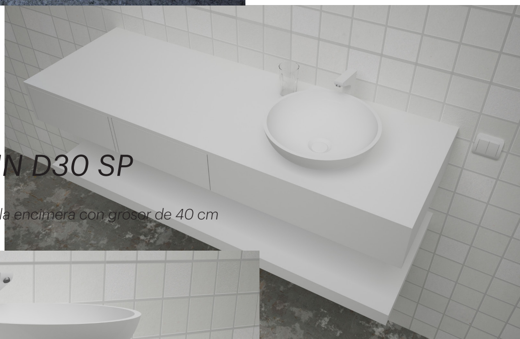
COIN D30 SP

Detalle cajón integrado en la encimera con grosor de 40 cm