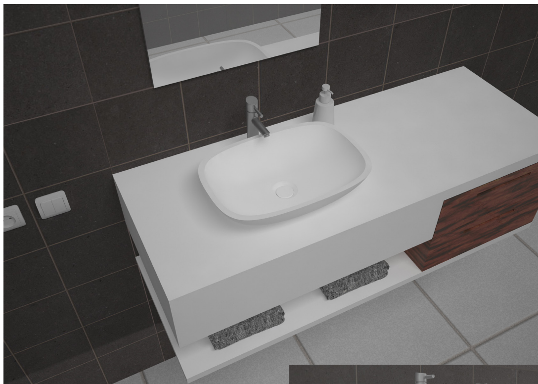
SOFT 2740 SP