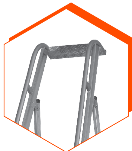
Bandeja porta herramientas