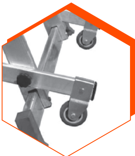
2 ruedas y 2 apoyos